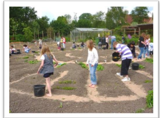
Educatieve tuin de Enk, Rotterdam

Stadslandbouw leent zich ook goed voor educatie. Landbouw dichtbij of in de stad biedt mogelijkheden om de stedeling van nabij te laten zien hoe voedsel groeit en wat er voor nodig is voordat het eten op je bord ligt. Educatie vindt vaak op boerderijen plaats, zoals op ‘t Hof Welgelegen in Middelburg. Schooltuinen zijn ook een goed voorbeeld van stadslandbouw als educatiebedrijf. Kinderen kunnen er zelf planten verzorgen en soms de groente zelf verwerken tot een gerecht zoals bij de Educatieve Tuin de Enk in Rotterdam. De Enk was een bosstrook van een kwart hectare die is omgevormd tot educatief permacultuur voedselbos met actieve participatie van buurtbewoners. De Enk beschikt over een blote-voeten-pad en een insectenpad ten behoeve van natuurbeleving. De tuin organiseert naast de schooltuinen ook andere activiteiten zoals buurtbrunches en kookworkshops. Naast educatiebedrijf is de Enk ook een producerende wijk initiatief. Een lokaal voorbeeld is het speelhof Hoogerzael in Middelburg.