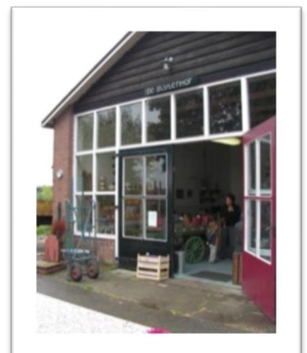
De Buytenhof, Rotterdam

De voedselboerderij is een stadsboerderij waar de agrarische tak een grote rol vervult. Hoewel een bedrijf in of in de nabijheid van de stad vaak ook andere diensten aanbiedt, is het produceren van voedsel de hoofdactiviteit van het bedrijf. Vaak worden de producten ook direct aan de stedeling verkocht. Naar onderzoek van Wells & Gradwell (2001) en de LTO hebben Voedselboerderijen waarde voor het bewustwordingsproces “weet wat je eet” en kan een bijdrage leveren aan de acceptatie van grote landbouw bedrijven. Gezien de schaal en type product van het bedrijf zal dit type waarschijnlijk op enige afstand van bebouwing te werk gaan. De grootschalige landbouw laat zich verder goed combineren met energieproductie (zie energiebedrijf). Een voorbeeld is boerderij de Buytenhof in Rotterdam. Deze boerderij met vlees-vee, akkerbouw en fruitboomgaard heeft zich gespecialiseerd in levering aan de stad. Een van de stallen is omgebouwd tot winkel. Daarnaast heeft de boerderij een restaurant en theetuin en het organiseert verder