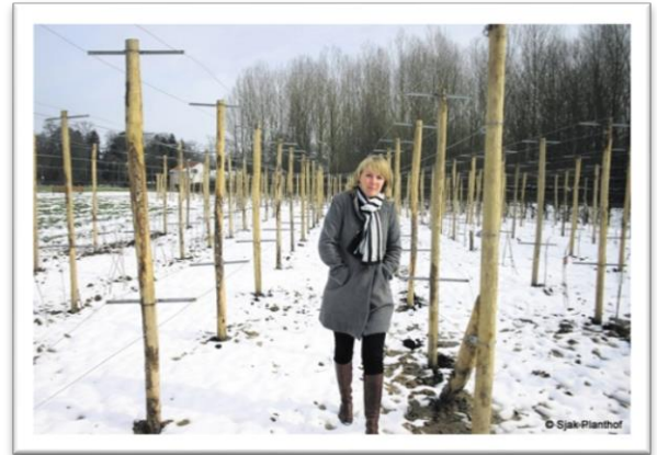
Kasteel Vaeshartelt, Maastricht

Onder een landgoed wordt doorgaans een 'groot stuk grond van meerdere hectares, met landerijen en tuinen en daarop een buitenplaats, landhuis, een grote boerderij, kerk of kasteel' verstaan. Deze kunnen landbouw (wijngaard, kruiden) combineren met verschillende publieksfuncties, zoals recreatie, educatie of zorg. Een voorbeeld hiervan is Kasteel Vaeshartelt dat circa vijf hectare van het landgoed heeft gereserveerd voor de verbouw van groente en fruit dat vervolgens gebruikt wordt in de eigen keuken en het restaurant alsmede wordt doorverkocht aan de horeca, leveranciers en belangstellenden uit de regio. Het landgoed combineert hiermee de functies voedselboerderij, distributiebedrijf en recreatiebedrijf (N.B. : Deze beschrijving is anders dan de eisen die aan een landgoed in het kader van een bestemmingsplan worden gesteld op grond van provinciaal en nationaal ruimtelijk beleid).