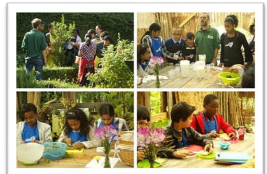
Wijk tuin de Esch, Rotterdam

Stadslandbouw kan bijdragen aan het vormen van ‘community’. Mensen werken samen in buurt of als vrijwilligers op boerderijen en leren elkaar op die manier kennen. Zo ontstaat er saamhorigheid in, betrokkenheid bij en vaak ook trots op de buurt. Een voorbeeld hiervan is Wijk tuin de Esch in Rotterdam, een buurttuin in de openbare ruimte op basis van permacultuur waar bewoners elkaar kunnen ontmoeten, samen tuinieren, informatie uitwisselen, eten en feestjes vieren.