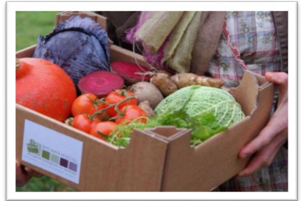
Groentebox Bio aan Huis, Rotterdam

Lokaal voedsel moet natuurlijk ook van de producent naar de consument kunnen komen. De gangbare kanalen via de retail zijn vaak niet ingesteld op de verkoop van lokale producten. Lokale productie vraagt vaak om maatwerk, vanwege de kleinere eenheden, lagere uniformiteit, seizoen gebondenheid of andere specifieke eigenschappen. Er zijn al vele voorbeelden van zogenaamde verkorte ketens, waarbij alternatieve wegen gezocht worden om de consument te bereiken. Sommige producenten verkopen hun producten aan huis, maar er zijn ook bedrijven die de distributie van lokaal voedsel verzorgen. Daarnaast zijn er voorbeelden waarbij ruimte wordt geboden aan lokale producenten om hun waar af te zetten, zoals boerenmarkten. Een voorbeeld hiervan is Hoeve Doelwyck/Bio aan huis in Rotterdam, een biologisch landbouwbedrijf dat een bezorgdienst en online verkoop heeft. Verder verkoopt het ook haar producten op de markt en via het Nationaal landschap Hoeksewaard. Een Zeeuws voorbeeld is Biologische kwekerij Zuidbos in Noordgouwe. Zij verbouwen zelf biologische groenten maar verkopen in hun winkel ook biologische producten van andere boeren, bieden groente- en fruitpakketten aan en doen aan internetverkoop. Daarnaast hebben ze wekelijks een biologische markt op hun erf, waarbij biologische boeren uit heel Zeeland hun waar aanbieden.