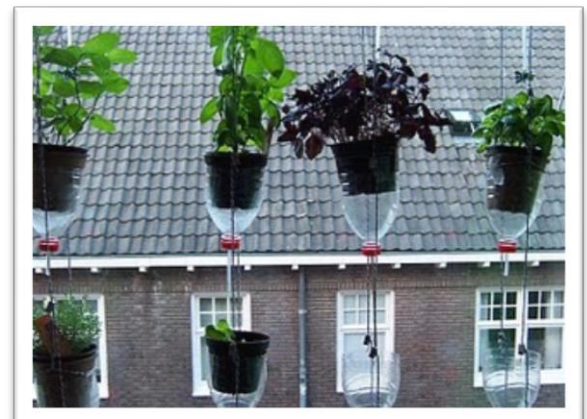
Raam tuinieren, Groningen

De kleinste schaal waarop stadslandbouw beoefend kan worden is op individuele schaal. Individuele stadslandbouw kan op allerlei manieren; van volkstuinen en kweken in de tuin tot balkonboeren in een vierkante meter tuin of raam tuinieren in gebruikte PET-fles. Een voorbeeld van raam tuinieren is te zien in de afbeelding hiernaast waar, door een systeem van petflessen en slangetjes een watersysteem wordt geconstrueerd. Deze vorm van stadslandbouw staat over het algemeen op zichzelf maar wordt vaak gestimuleerd door andere vormen van stadslandbouw zoals het educatiebedrijf, het zorgbedrijf, distributiebedrijf, de producerende wijk en intensieve groene daken